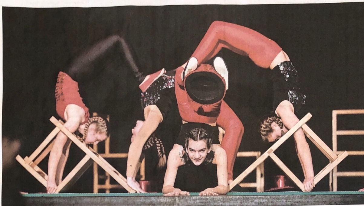
Die Welt steht kopf. Oder so ähnlich. Dass im Zirkus alles möglich ist, bewiesen die Artistinnen und Artisten des Hinwiler Kinderzirkus.