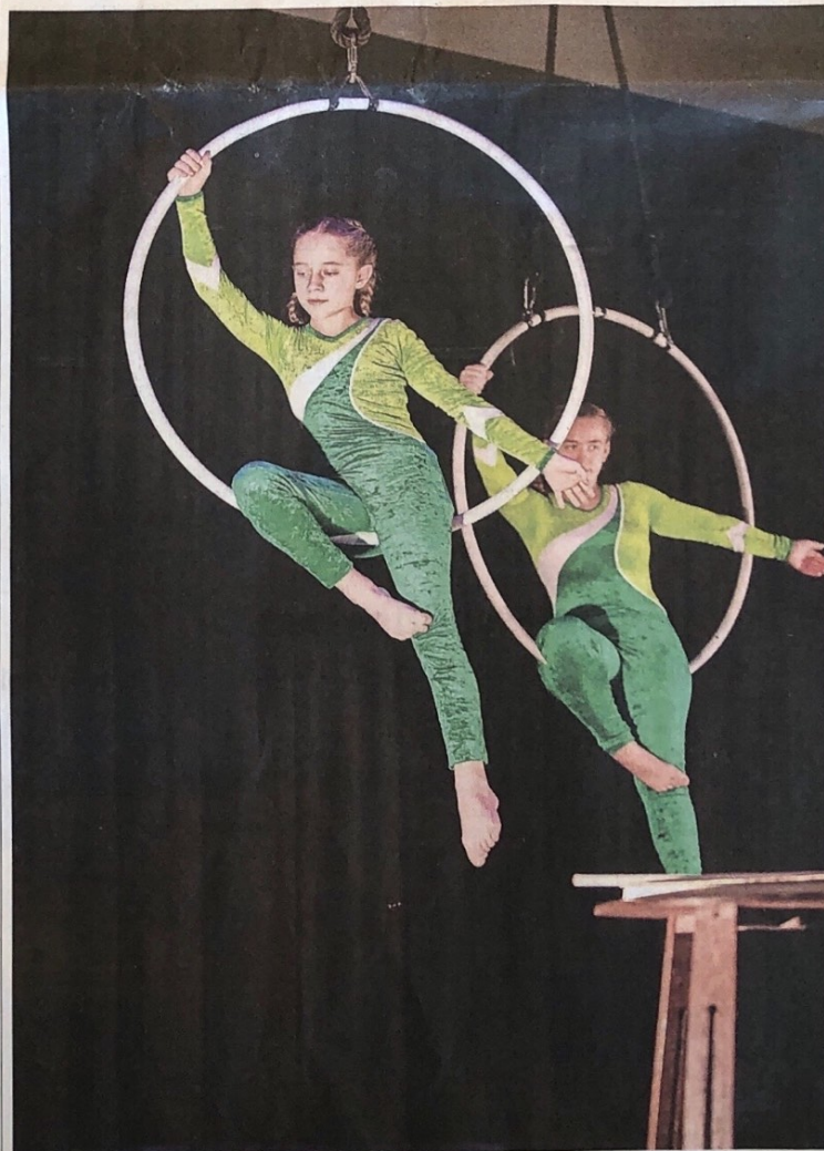
Hinwil Das neueste Programm des Kinderzirkus Hinwil trägt den Titel «Die Zauberreise». Am Samstag war Premiere. Seite 3