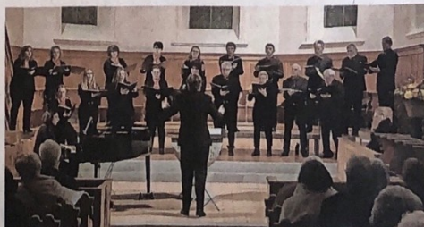
In der reformierten Kirche Hombrechtikon begann am Freitag die Tournee der Operettenbühne Hombrechtikon.

Als Nächstes stehen in der Region Auftritte im «Kreuz» in Rapperswil-Jona (Freitag, 5. Februar, 20 Uhr), Rüti (Sonntag, 7. Februar, 17 Uhr), in Greifensee (Freitag, 11. Februar, 20 Uhr) und in Hinwil (Samstag, 12. Februar, 20 Uhr im «Hirschen») an. (zo)